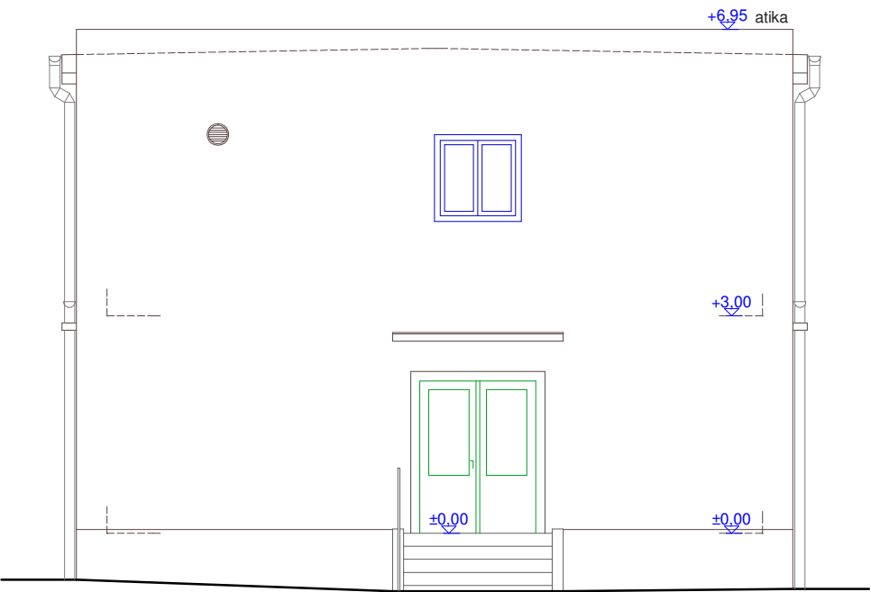
Pohledy východní (boční)